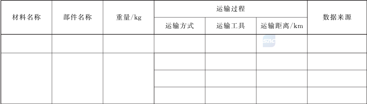
表 2 外购零部件的数据收集清单