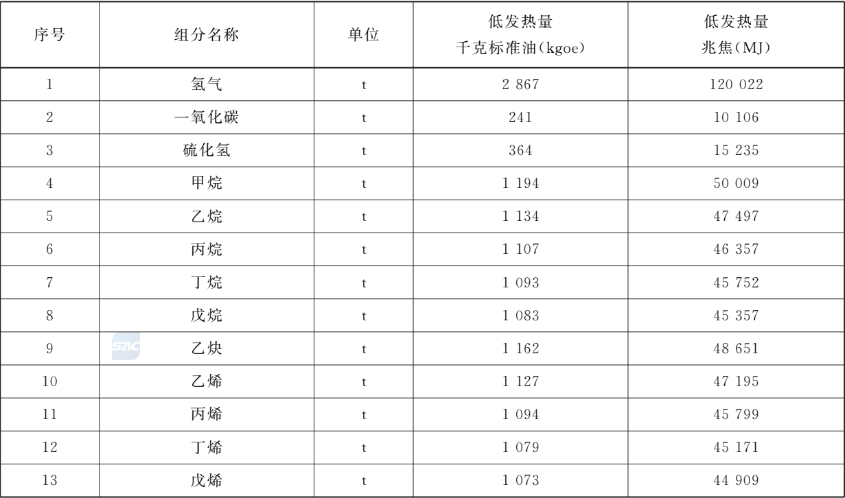
表 E.1 常用纯组分低发热量